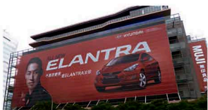
Lona Mesh Publicitaria