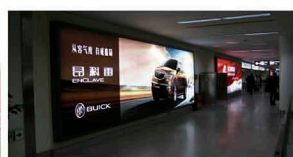
Caja de luz Backlite